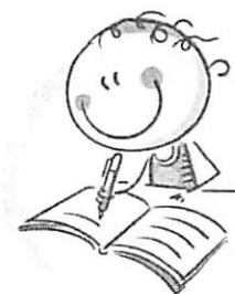
4. СИДИТЕ ПРАВИЛЬНО