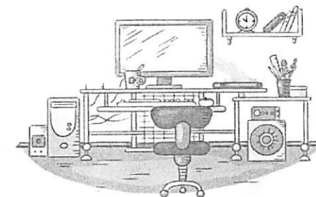
5. СООТВЕТСТВИЕ МЕБЕЛИ