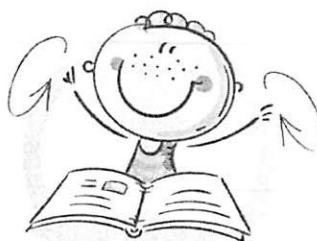
2. ФИЗКУЛЬТМИНУТКА ДЛЯ СНЯТИЯ УТОМЛЕНИЯ С ПЛЕЧЕВОГО ПОЯСА И РУК