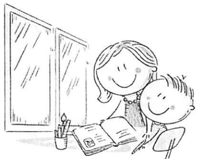
1. ЕСТЕСТВЕННОЕ ОСВЕЩЕНИЕ

ЕДИНЫЙ КОНСУЛЬТАЦИОННЫЙ ЦЕНТР РОСПОТРЕБНАДЗОРА 8-800-555-49-43