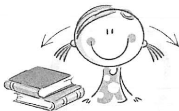
1. ФИЗКУЛЬТМИНУТКА ДЛЯ УЛУЧШЕНИЯ МОЗГОВОГО КРОВООБРАЩЕНИЯ