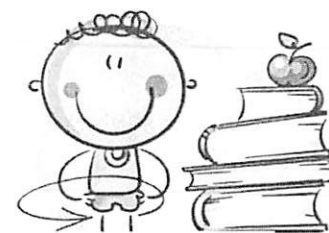
3. ФИЗКУЛЬТМИНУТКА ДЛЯ СНЯТИЯ УТОМЛЕНИЯ КОРПУСА ТЕЛА