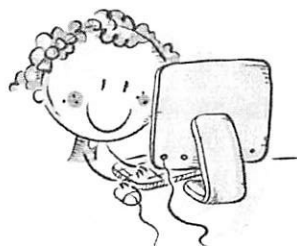
2. ПОЛОЖЕНИЕ МОНИТОРА