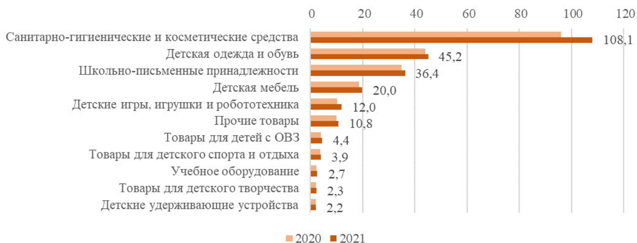
Прогноз производства товаров для детей в 2021 г., млрд руб.

Объем рынка товаров для детей в 2020 году составил 832 млрд рублей (2019 г. – 843 млрд рублей), при этом на 1 600 российских производителей пришлось 228 млрд рублей.